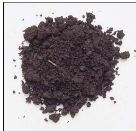
Contoh pasir yang kering udara \pm 600 gr