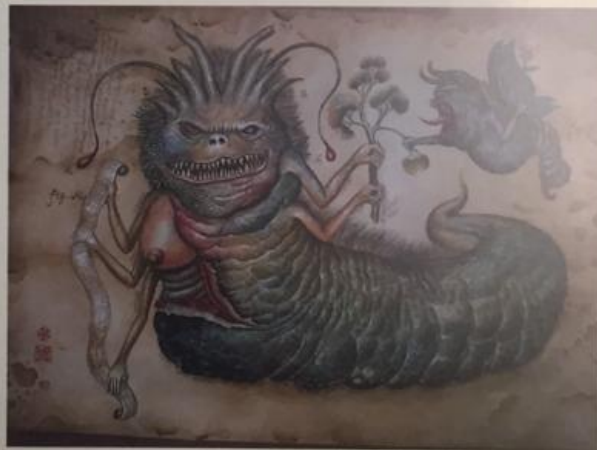
【 The Mythical Creatures 】 (神話の幻獣) Water Color on Paper