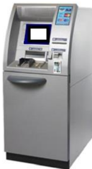
Gambar 10. Perancangan Mesin ATM