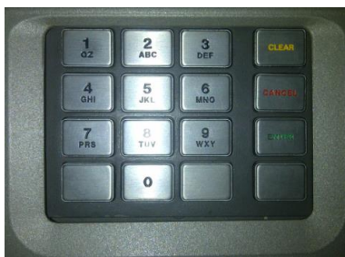
Gambar 3. Keypad /Tombol Numerik ATM Aktual