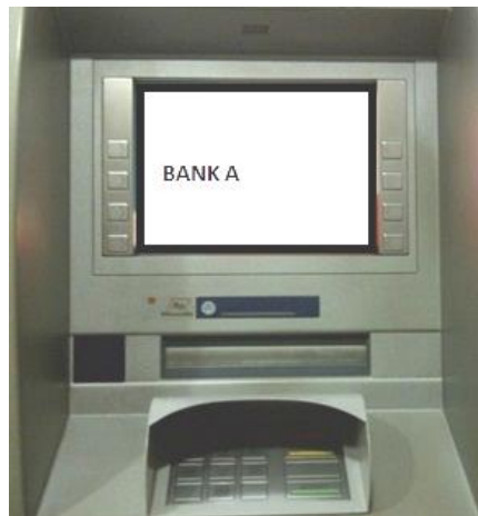
Gambar 7. Alternatif 1 Letak Tempat Pengambilan Uang

Pada perancangan letak tempat pengambilan uang alternatif 1, tempat pengambilan uang diletakkan diantara layar monitor dan tombol numerik.