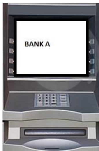
Gambar 8. Alternatif 2 Letak Tempat Pengambilan Uang