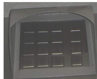
Gambar 4. Penutup Keypad /Tombol Numerik ATM Aktual