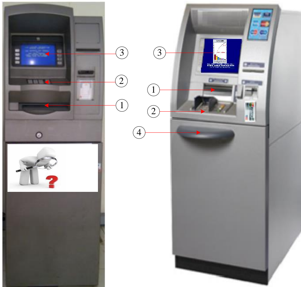
Mesin ATM Aktual