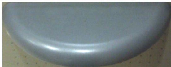
Gambar 9. Perancangan Desain Tempat Menaruh Barang

Pengguna ATM pada umumnya membawa barang-barang ke dalam ruangan ATM. Barang-barang bawaan tersebut dapat berupa tas, botol minuman, dan lain-lain. Pengguna ATM membutuhkan tempat yang dapat digunakan untuk menaruh barang-barang tersebut agar lebih mudah dalam melakukan transaksi. Oleh karena itu diberikan usulan desain tempat menaruh barang bawaan nasabah.