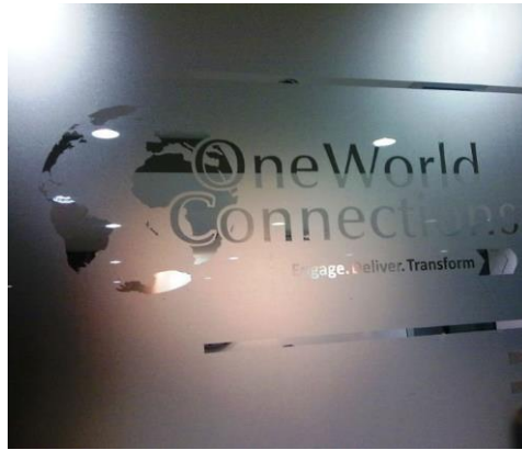
Gambar 13. Contoh Kaca Yang Diberi Stiker

Pada sisi ruangan ATM yang berbatasan dengan ruangan ATM disebelahnya, sebaiknya diberi stiker yang tidak transparan untuk menghindari orang lain melihat kegiatan nasabah pada saat menggunakan ATM.