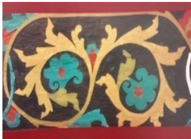
Gambar 6. Embun Sikawiten