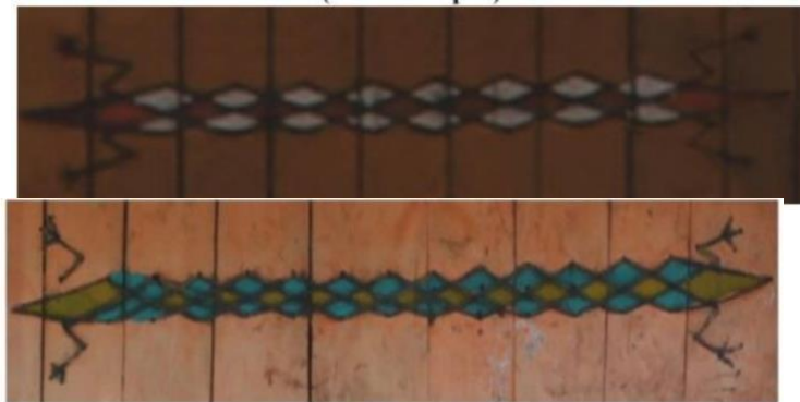
Gambar.8 Pengereteret dengan warna berbeda Sumber : Fauzi Jufli 2012

Ragam hias yang dimiliki oleh masyarakat Karo beragam jenis, motif dan juga makna. Ada kalanya satu ragam hias tetapi mengandung banyak makna. Misalnya ragam hias Tapak Raja Sulaiman (pada gambar 2) memiliki makna sebagai penolak bala, menahan roh roh jahat, anti racun, dan penunjuk jalan apabila tersesat di perjalanan terutama di hutan. Penerapan ragam hias pada dinding (derpih) tidak selalu berdiri sendiri. Beberapa ragam hias dipadukan menjadi satu. Warna ragam hias terdiri atas merah, hitam dan kuning. Selain ditempatkan pada rumah adat, ragam hias juga diimplementasikan pada berbagai perlengkapan yang digunakan sehari hari. Misalnya pada ukat (sendok sayur), gantang (sejenis alat takar beras), cincin, kalung anak anak, cimba lau (gayung) serta pada pakaian adat seperti; uis gara, tudung, bulang bulang dan sebagainya (Tarigan 2018 : 276).