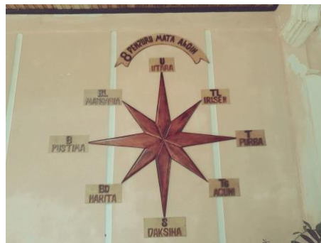
Gambar 1. Desa Siwaluh