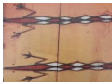
Gambar 4 Pengeret ngeret