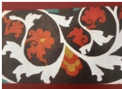
Gambar 7. Tulak Paku