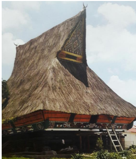
Gambar 11. Rumah Adat Karo Siwaluh Jabu

Struktur bangunan rumah adat dibuat dengan bentuk persegi panjang, dibagian dalam rumah tidak banyak ruangan. Rumah adat Karo berfungsi sebagai tempat tinggal seperti (berteduh, berlindung, memasak dan makan, bersosialisasi dan istirahat/tidur) namun untuk keperluan mandi, cuci, toilet tidak terdapat di dalam rumah adat Karo. Untuk keperluan mandi, cuci dilakukan di luar rumah, biasanya dilakukan di sungai atau pancuran/toilet umum yang dibuat semi terbuka. Temboknya hanya setinggi rata rata orang dewasa dan tidak ada pintu.