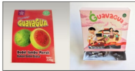
Gambar 4. Kemasan dodol jambu merah GuavaGua sebelum dan sesudah re-desain

Kemasan GuavaGua yang dire-desain dengan bukaan pada bagian bawah terlihat lebih kustom. Ciri geografis diperlihatkan melalui salah satu ikon bangunan di Soreang.