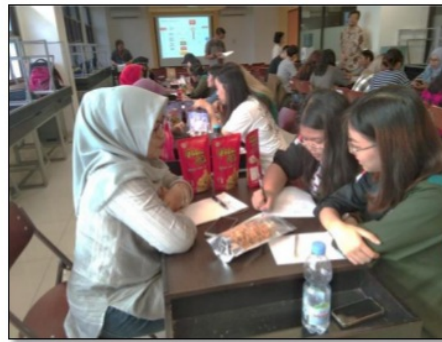
Gambar 5. Proses edukasi partisipatif dalam bentuk klinik kemasan