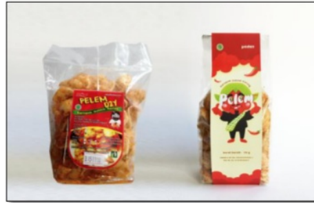
Gambar 3. Kemasan krupuk seblak Pelem D2y sebelum dan sesudah re-desain

Desain kemasan ekonomis yang sudah di re-desain memiliki konsep, tidak sekedar "me too". Labellingnya terlihat modern walaupun hanya menggunakan karton yang sederhana. Gambar ikon si Cepot yang ditampilkan juga memberi kesan modern, tanpa meninggalkan budaya lokal Jawa Barat.