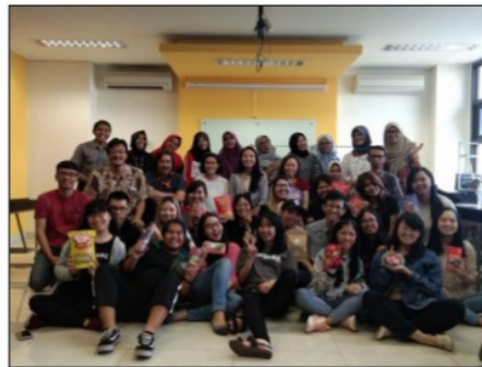
Gambar 6. Peserta FGD dalam kegiatan pengabdian masyarakat.