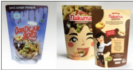
Gambar 2. Kemasan sus kering merk Cantique Soes sebelum re-desain dan sesudah re-desain berubah menjadi merk Nukuma.

Pada proses re-desain kemasan Cantique Soes berubah merk menjadi Nukuma. Pada desain baru terdapat konsep sebagai berikut, warna krem dan lelehan coklat menggambarkan produk. Ciri lokal Jawa Barat diperlihatkan melalui gambar gadis berkebaya dan sampung (kain bagian bawah) dengan motif khas Jawa Barat.