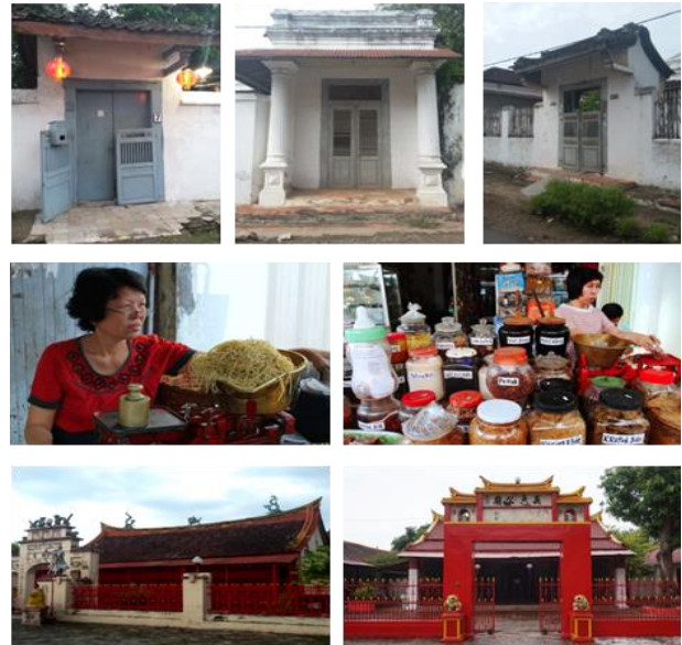
Gambar 3. Komponen Umum Kawasan Pecinan: Perumahan, Pasar dan Klenteng

tertentu. Penulis memiliki persepsi sendiri tentang gerbang rumah Peranakan di tiga daerah Pecinan, Lasem.