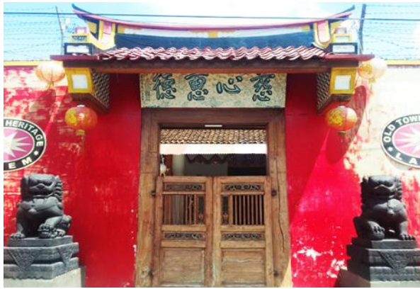
Gambar 7. Dekorasi Cenderung Ramai pada Gerbang Rumah Peranakan Lasem. (Sumber : Dokumentasi Pribadi, 2019)

Meskipun berasal dari masa lalu, gerbang-gerbang ini mengambil bagian hingga hari ini. Mereka tidak hanya penuh dengan cerita sejarah dan budaya, tetapi juga sebagai bagian dari sebuah karya seni. Bahkan, secara tidak langsung, sebuah karya yang memiliki nilai tidak berwujud akan lebih mudah bertahan hidup seiring berjalannya waktu karena ia memiliki kekuatan untuk menembus periode dan bertahan dari periode klasik ke periode kontemporer. Gerbang paling sering menjadi latar belakang foto gaya kontemporer. Oleh karena itu, dapat dikatakan bahwa keberadaan gerbang berkontribusi terhadap gaya hidup saat ini, dan secara tidak langsung menjadi bagian dari upaya pelestarian budaya.