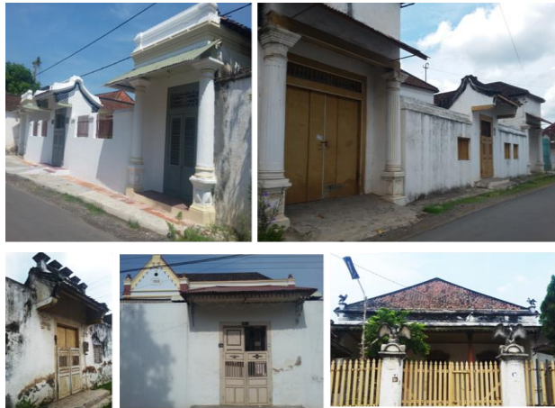
Gambar 5. Contoh Nilai Tangible : Budaya Belanda: Gerbang Rumah Peranakan, Lasem Di kawasan Karangturi (atas) dan Babagan (bawah).

Mengalami tiga kawasan Pecinan berulang kali memberikan pemahaman yang lebih dalam tentang nilai-nilai penting yang terkandung di dalamnya. Suasana menciptakan “imajinasi puitis” yang sangat memengaruhi perasaan; rasa bangga, sedih dan marah ketika saya melihat keadaan dan kondisi gerbang-gerbang tersebut. Penulis bangga dengan kekayaan sejarah dan budaya, sedih karena banyak yang dilupakan, dan marah karena karakter unik dari gerbang tampaknya ter/diabaikan. Bahkan, Pallasmaa dalam Steven Holl (1994) mengungkapkannya lebih puitis dengan berpendapat bahwa keadaan, kewujudan arsitektur lebih lengkap dari bentuk seni lainnya dan dapat mempengaruhi persepsi sensorik seseorang.