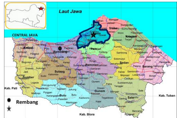
Gambar 2. Lokasi Rembang dan Kecamatan Lasem, Jawa tengah

Kota ini akan memberikan pengalaman berwisata dalam kesederhanaan namun dipenuhi dengan kekayaan cerita sejarah dan budayanya.