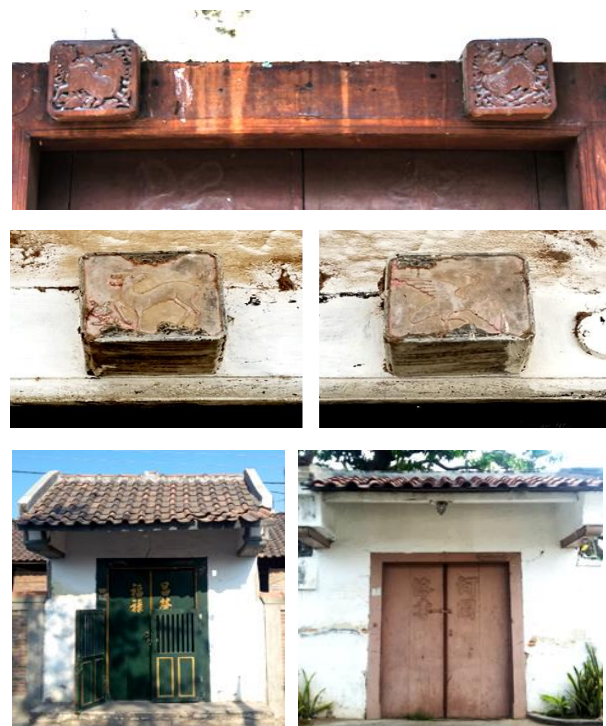
Gambar 4. Contoh Nilai Intangible : Budaya Tionghoa-Gerbang Rumah Peranakan, Lasem. Kilin (atas), Rusa dan Bangau (tengah) & Tulisan Hanzi (bawah)