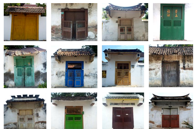
Gambar 6. Berbagai Desain Gerbang Rumah Peranakan, Lasem di Soditan (atas), Karangturi (tengah), dan Babagan (bawah). (Sumber: Dokumentasi Penulis, 2017-2019)