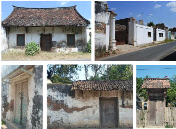
Gambar 1. Berbagai Kerusakan Gerbang dan Rumah Peranakan Tionghoa di Lasem, Jawa tengah

karena itu dapat memberikan arti tersendiri terhadap gerbang.