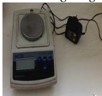
Neraca analitis digital