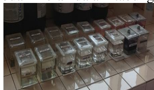
Pembuatan preparat histopatologis