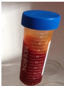
Minyak buah merah dalam tabung falcon