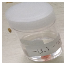
Sampel dimasukkan ke dalam tabung urin yang berisi larutan buffer formalin 99%.