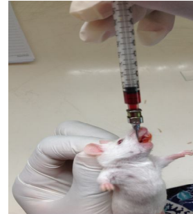
Pemberian minyak buah merah sesuai desain penelitian pada mencit betina hamil