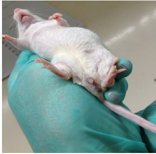
Pemeriksaan sumbat vagina pada mencit