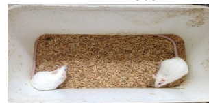
Mencit jantan dan betina galur Swiss Webster