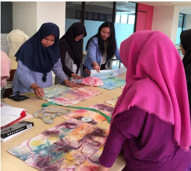
Gambar 13: Peserta mulai membuat ukuran tas langsung ke atas kain setelah memahami bentuk tas yang ingin dibuat. Memanfaatkan kain seoptimal mungkin, hemat, tidak banyak membuang sisa.

Peserta mendapatkan pendampingan selama melakukan eksplorasi model tas sesuai dengan daya kreasinya masing-masing. Instruktur memberi pengarahan dalam menentukan besarnya ukuran tas, cara mengukur di atas kain, cara memotong, berbagai kemungkinan model tas dan aplikasi tambahan untuk memberi diferensiasi model. Pemotongan pola tas perlu dibuatkan jarak untuk kelim jahitan atau kampung agar diperoleh jahitan yang bersih dan rapi.