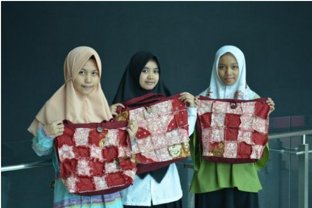
Gambar 1: Tas Jinjing dengan olahan Patchwork Cutting dipadukan dengan Unfinished Seam . PkM RT02 RW04 kelurahan Sukawarna Kecamatan Sukajadi, Bandung di sesi PKM sebelumnya. Dokumentasi: prodi DIII SRD FSRD UK Maranatha.

Warga telah mendapatkan pengayaan reka tekstil patchwork pada kegiatan Pengabdian kepada Masyarakat yang pertama yaitu pada kesempatan sebelumnya. Reka tekstil tersebut kemudian diolah lanjut dengan sentuhan tarik serat/ Unfinished Seam sehingga menghasilkan produk desain tas jinjing yang kontemporer.