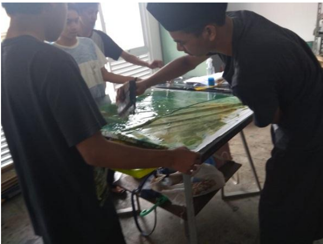
Gambar 3: Raket digunakan untuk membersihkan pasta tapioka yang menempel terbawa oleh kain saat kain yang telah ditempelkan pada lukisan, diangkat.

Pada pelatihan medium yang digunakan untuk menahan zat warna tidak larut ke bawah adalah pasta tapioka yaitu tepung tapioka yang dilarutkan dan dibuat menjadi bubur dengan kekentalan sedang sedikit encer. Pasta tapioka ini dipilih selain harganya yang murah, mudah diperoleh, mudah dibuat serta ramah lingkungan. Pasta tapioka ini berfungsi untuk menahan zat warna tidak turun atau tenggelam ke bawah karena berat jenis yang naik setelah menjadi bubur kental. Zat warna yang telah dituangkan ke atas pasta dengan mudah dibentuk menjadi lukisan karena sifat pasta yang licin memudahkan tarikan garis mengalir dengan bebas. Lukisan yang telah selesai dibentuk akan tetap terapung diatas pasta sehingga mudah diserap oleh kain. Kain yang digunakan dalam prakti ada kain Baby Canvas polos warna putih, lukisan di atas pasta akan berpindah ke kain setelah kain diangkat. Selanjutnya kain dibersihkan dengan menggunakan rakel kemudian kain dicuci dengan air dan dijemur hingga kering. Setelah pengeringan selesai kain tekstur marbling siap digunakan untuk membuat pola produk tas.