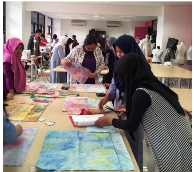
Gambar 12: Peserta diberi pengertian berbagai eksplorasi yang bisa dilakukan seperti:perbedaan bentuk pola, teknik pemotongan, penambahan aplikasi atau teknik jahit yang bisa dikembangkan agar hasil tas sesuai keunikan masing-masing peserta.