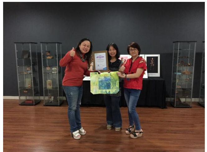
Gambar 15: Perwakilan donatur PT Multi Sandang mendapatkan ucapan terima kasih dari prodi berupa sertifikat dan karya tas hasil pelatihan.

Pelatihan tas jinjing seni Ebru ini adalah pelatihan ke dua kalinya yang dilakukan dalam kemitraan antara Program Studi DIII Seni Rupa dan Desain, Fakultas Seni Rupa dan Desain sebagai pihak pemberi pengetahuan, PT Multi Sandang sebagai pihak donatur tekstil, penyedia kain baby cotton dengan masyarakat RT 02 RW 04 Kelurahan Sukawarna, Kecamatan Sukajadi Bandung sebagai pihak peserta. Pelatihan ke dua ini masih bersifat penjangkaran, penggalan minat, pencarian peserta yang kreatif dan berbakat untuk diteruskan ke pembinaan lebih lanjut. Di kemudian hari, pelatihan-pelatihan yang terus digalakan mampu menghasilkan bibit-bibit baru pelaku industri kreatif.