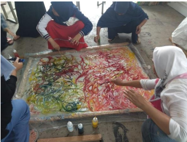
Gambar 8: Dibutuhkan kepekaan menuangkan warna dan membentuk garis-garis estetis. Diperlukan banyak percobaan dan evaluasi untuk hasil yang unik.