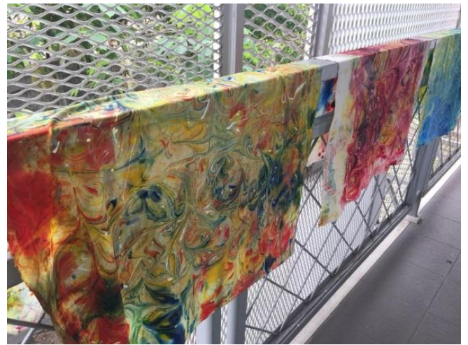
Gambar 4: Kain baby canvas setelah dibersihkan dari sisa warna dan pasta yang menempel kemudian dijemur hingga kering, diseterika dan siap dibuat pola produk tas.