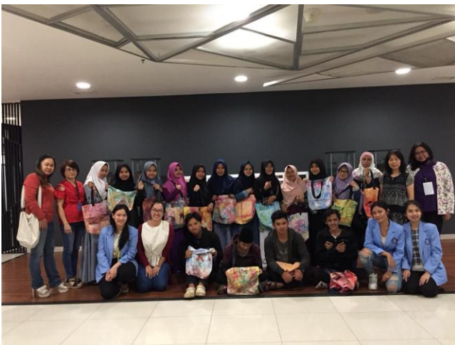
Gambar 17: Foto Bersama se usai kegiatan: Perwakilan PT Multi Sandang, peserta, dosen dan mahasiswa Dokumentasi: prodi DIII SRD FSRD UK Maranatha

Pelatihan berjalan efektif, peserta mengikuti pelatihan dengan seksama, terjadi korelasi yang kooperatif antara dosen, mahasiswa dengan peserta. Masyarakat peserta terlihat gembira, walau hasil belum maksimal, sebagian besar dari peserta menyambut aktivitas dengan antusias dan merasa bangga dengan hasil yang diperoleh.