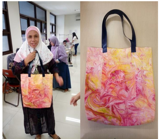
Gambar 14: Tas Jinjing hasil teknik seni Ebru yang unik dan menarik.

Secara garis besar seluruh peserta mampu mengikuti seluruh kegiatan yang dilakukan selama 2 kali pertemuan., Pertemuan pertama menyelesaikan aktivitas olah seni ebru hingga pengeringan. Pertemuan ke dua mengerjakan pembuatan pola tas di atas kain yang telah bertekstur seni ebru hingga penjahitan tas jinjing sampai selesai.