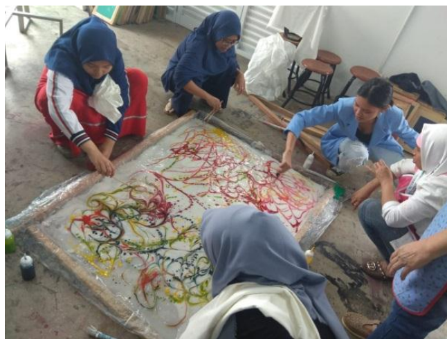
GAMBAR 7: LARUTAN WARNA COLORANT DITUANGKAN KE ATAS PASTA TAPIOKA DAN DIBENTUK MENJADI LUKISAN MARBLING.