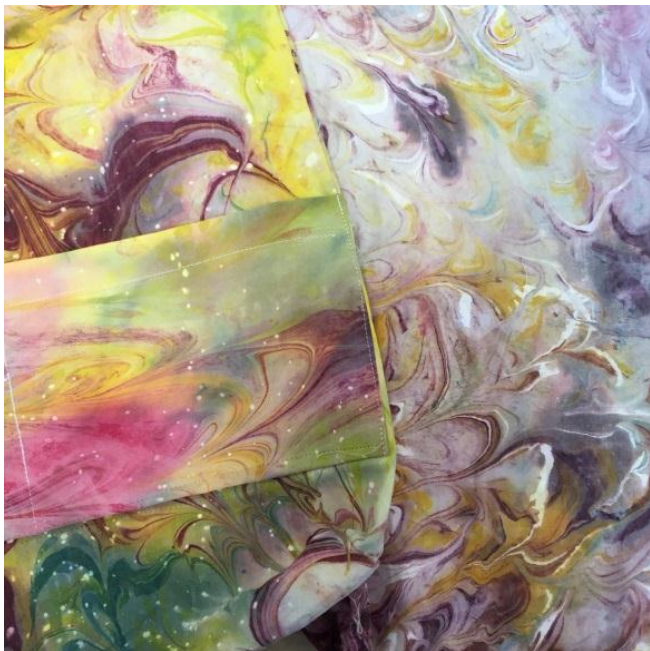
Gambar 5: Eksplorasi warna tekstur marmer Dokumentasi: prodi DIII SRD FSRD UK Maranatha.

Perpaduan warna dapat dipilih dari warna muda monochromatic layaknya marmer alami atau dapat dieksplorasi sendiri dengan warna yang lebih cerah ( hue ), warna gelap ( shade ) atau perpaduannya sesuai pilihan peserta. Larutan warna colorant dan sejenis yang sudah dilarutkan air dengan perbandingan 1 : , ditampung dalam botol aplikator yaitu botol plastik dengan tutup botol berlubang kerucut, sehingga mudah di teteskan atau dikururkan ke atas permukaan pasta tapioka yang sudah dibentangkan di atas lembaran beralas plastik.