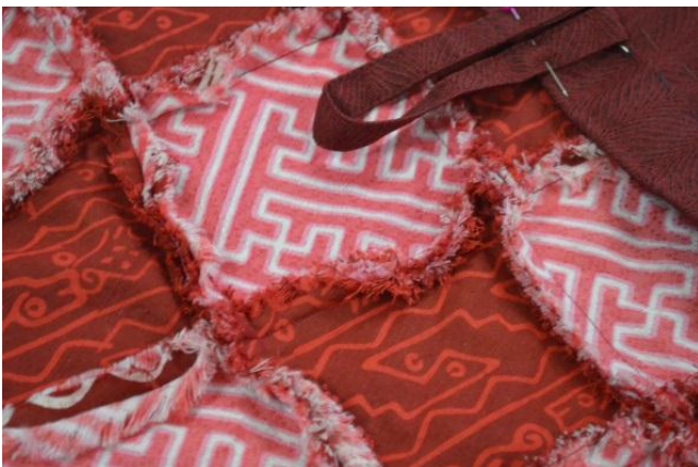
Gambar 2: Kampuh dibuat tercerabut ( unfinished seam ) dengan teknik cabut serat kain sehingga nampak bervolume, melambai estetik. Dokumentasi: prodi DIII SRD FSRD UK Maranatha.

Pada kesempatan ke dua ini prodi memberi pelatihan untuk menambahkan perbendaharaan dan pengembangan lanjut ketrampilan yaitu seni ebru yang dipindahkan ke atas kain baby canvas dengan maksud hasil reka tekstil seni ebru ini dapat dimanfaatkan untuk membuat berbagai macam produk satu diantaranya adalah tas jinjing. Tujuan pelatihan agar masyarakat terlatih dan terbiasa berkreasi menghasilkan karya desain yang inovatif hingga menjadi stimulus yang dapat terus dikembangkan secara mandiri.