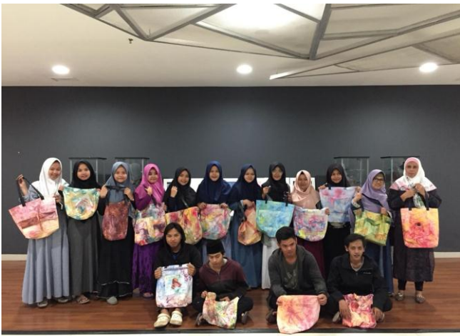
Gambar 16: Peserta pelatihan dengan karya tas jinjing teknik seni Ebru masing-masing