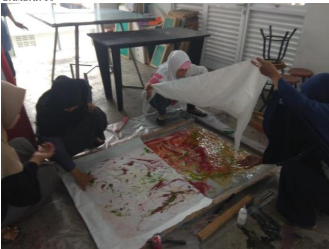
Gambar 9: Lukisan dipindahkan ke kain baby canvas , dengan cara ditekan-tekan kemudian diangkat perlahan, dipindahkan ke atas meja, untuk dibersihkan dari sisa-sisa pasta dengan rackel, selanjutnya dicuci dan dijemur hingga kering. Dokumentasi: prodi DIII SRD FSRD UK Maranatha