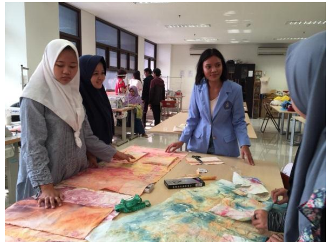
Gambar 11: Kain hasil olah seni ebru mulai di buat ukuran sesuai pola standar tas dan kemungkinan eksplorasinya sesuai minat peserta. Dokumentasi: prodi DIII SRD FSRD UK Maranatha.