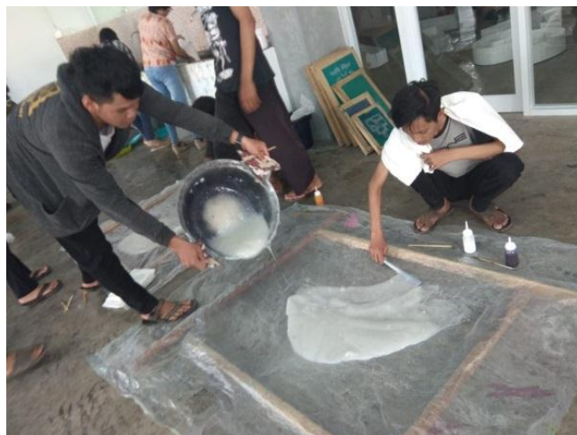
Gambar 7: Pasta tapioka dengan kekentalan sesuai, siap menjadi media lukisan seni ebru untuk dipindahkan ke atas media tekstil. Dokumentasi: prodi DIII SRD FSRD UK Maranatha.

Bila terlalu kental larutan warna yang di jatuhkan ke atas permukaan sulit ditarik menjadi garis-garis estetis. Sebaliknya bila terlalu encer larutan warna yang di jatuhkan ke atas permukaan pasta cenderung tenggelam ke bawah, lukisan warna tidak bisa dipindahkan. sehingga sulit memperoleh lukisan yang baik.