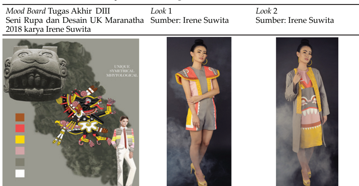
Tabel 5. Busana 'Lamidexo' inspirasi dari mitologi suku Astec