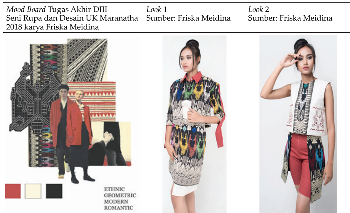
Tabel 10. Busana 'Koleksi Sasak' inspirasi dari tradisi kain songket etnis Lombok