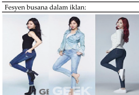
Tabel 2. Busana denim dalam iklan

Keseluruhan pesona itu dapat diraih karena kecanggihan teknologi iklan dalam meramu produk industri dengan tampilan yang memikat dan menjanjikan. Produk industri kecantikan dan mode itu disebarluaskan melalui media yang dikemas begitu menawan dengan paket-paket komoditas yang senantiasa disertai imaji perempuan ideal menurut selera pasar. Adanya dorongan bahwa