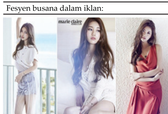
Tabel 1. Busana ready to wear dalam iklan