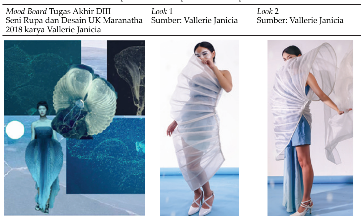
Tabel 7. Busana 'Antrachoda' inspirasi dari larva pemakan mikroplastik di laut