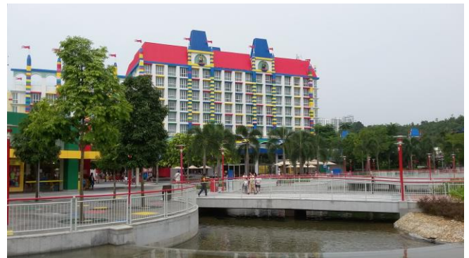
Gambar 5. Bangunan hotel menyerupai bentuk lego di Legoland Malaysia

Hal serupa dilakukan Legoland Malaysia yang membuat bangunan hotel seperti terbuat dari lego-bricks . Pengunjung taman bermain yang hampir semuanya membawa anak-anak akan tertarik untuk menginap di hotel tersebut ketika hendak mencari tempat penginapan.