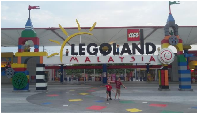
Gambar 2. Legoland Malaysia

Langkah inovatif yang sama telah dilakukan oleh pengusaha di kota Malang yang membangun Jatim Park, dari semula hanya sebuah bukit menjadi obyek wisata yang terkenal di Asia Tenggara.