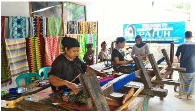
Gambar 11. Koperasi Tenun Ikat di Pulau Lombok

Hampir semua hal untuk keperluan wisata bisa dipesan dan dibayar melalui jaringan on-line . Bisnis pariwisata pun tak luput dari bentuk kerjasama tersebut, bahkan Mc Comb et.al (2016) [5] menyatakan kolaborasi antar mereka yang berkepentingan dalam bisnis pariwisata merupakan prasyarat pariwisata berkelanjutan. Bentuk kerjasama yang dapat dilakukan tidak harus selalu dengan modal besar dan teknologi canggih, tetapi harus berdasarkan itikad baik untuk saling menguntungkan, misalnya: kolaborasi antara tour and travel dengan koperasi tenun ikat di Pulau Lombok. Wisatawan yang dibawa ke pusat koperasi tenun ikat di Pulau Lombok mendapat pengalaman baru yaitu melihat cara menenun tradisional, hal ini akan meningkatkan nilai jual tour and travel tersebut. Di sisi lain dari sekian banyak wisatawan yang berkunjung ke pusat koperasi tenun ikat tersebut ada saja yang membeli kain hasil tenun untuk dibawa sebagai souvenir . Jadi pada hakekatnya kerjasama keduanya akan menguntungkan semua pihak.