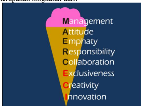
Gambar 11. Ilustrasi singkatan ice-cream agar mudah diingat.

Dari serangkaian kata kunci di atas dapat dibentuk suatu singkatan yang mudah diingat, yaitu: ice-cream. Ice-cream merupakan singkatan dari: