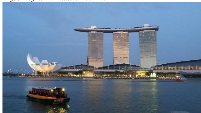
Gambar 1. Pemandangan di Marina Bay Sands Singapore

Beberapa contoh inovasi yang telah dilakukan oleh negara tetangga, Singapura dan Malaysia, antara lain adalah membangun suatu obyek wisata baru dari suatu lingkungan yang sebelumnya bukan tujuan wisata, seperti Marina Bay Sands Singapore dan Legoland Malaysia yang kemudian menjadi tujuan wisatawan dunia.