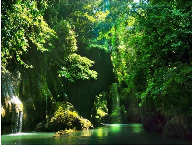
Gambar 13. Green Canyon, Pangandaran Jawa Barat [12]