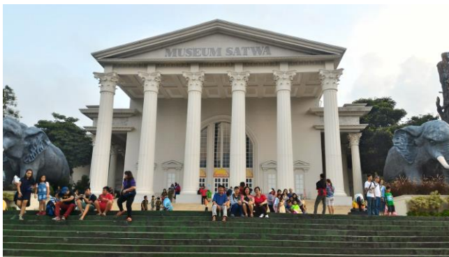
Gambar 3. Museum Satwa yang didirikan di atas bukit di Jatim Park

Langkah inovatif yang sama telah dilakukan oleh pengusaha di kota Malang yang membangun Jatim Park, dari semula hanya sebuah bukit menjadi obyek wisata yang terkenal di Asia Tenggara.