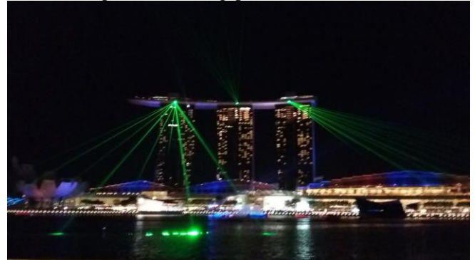
Gambar 4. Pertunjukan sinar laser saat malam di Marina Bay Sands

Hal sebaliknya dilakukan oleh pengelola obyek wisata Marina Bay Sands Singapore dan Legoland Malaysia. Pada malam hari di Marina Bay Sands dipertontonkan tarian laser yang ditunggu-tunggu pengunjung. Tarian laser ini dapat dinikmati oleh setiap pengunjung Marina Bay Sands tanpa harus membayar apa pun, cukup dengan sabar menunggu di pinggir marina atau bisa juga sambil duduk di salah satu restoran di sana sambil menikmati menu hidangan. Hal ini dapat meningkatkan jumlah pengunjung restoran dan meningkatkan jumlah pendapatan restoran di sana yang pada gilirannya akan meningkatkan jumlah pajak penjualan yang akan diterima pemerintah Singapura.