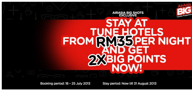
Gambar 10. Iklan kerjasama AirAsia dengan Tune Hotels

Hampir semua hal untuk keperluan wisata bisa dipesan dan dibayar melalui jaringan on-line . Bisnis pariwisata pun tak luput dari bentuk kerjasama tersebut, bahkan Mc Comb et.al (2016) [5] menyatakan kolaborasi antar mereka yang berkepentingan dalam bisnis pariwisata merupakan prasyarat pariwisata berkelanjutan. Bentuk kerjasama yang dapat dilakukan tidak harus selalu dengan modal besar dan teknologi canggih, tetapi harus berdasarkan itikad baik untuk saling menguntungkan, misalnya: kolaborasi antara tour and travel dengan koperasi tenun ikat di Pulau Lombok. Wisatawan yang dibawa ke pusat koperasi tenun ikat di Pulau Lombok mendapat pengalaman baru yaitu melihat cara menenun tradisional, hal ini akan meningkatkan nilai jual tour and travel tersebut. Di sisi lain dari sekian banyak wisatawan yang berkunjung ke pusat koperasi tenun ikat tersebut ada saja yang membeli kain hasil tenun untuk dibawa sebagai souvenir . Jadi pada hakekatnya kerjasama keduanya akan menguntungkan semua pihak.