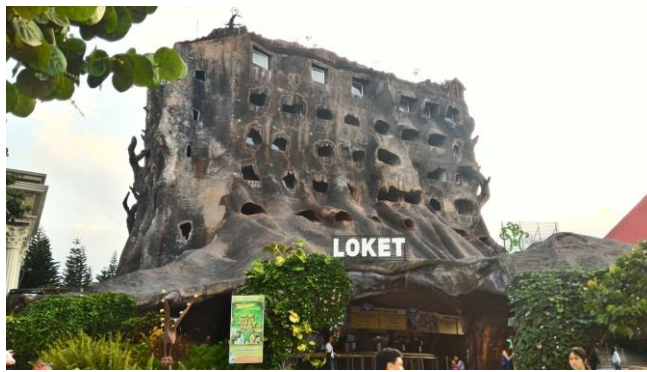
Gambar 6. Bangunan hotel menyerupai tunggul pohon di Jatim Park

Dengan adanya kreativitas dalam mengelola obyek pariwisata maka wisatawan akan datang kembali dan membuat obyek pariwisata tersebut semakin berkembang dan berkelanjutan. Hal ini sejalan dengan yang dikemukakan oleh Canavan (2016) [2] bahwa kreativitas dalam pariwisata adalah proses penting bagi mereka yang terlibat dalam pengelolaan pariwisata berkelanjutan.