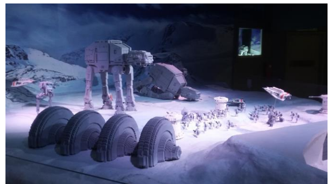
Gambar 8. Diorama Star Wars terbesar di Asean di Legoland Malaysia