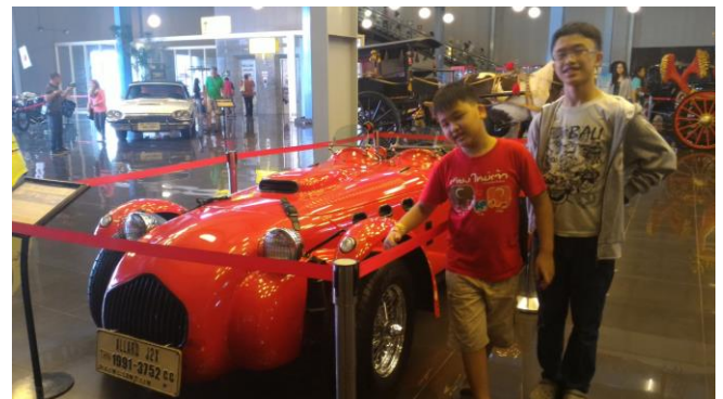
Gambar 9. Museum Angkut, terlengkap di Asean di Jatim Park Malang