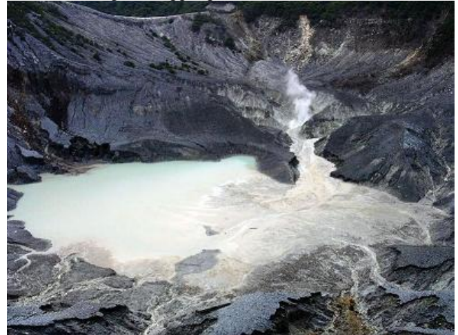
Gambar 12. Kawah gunung Tangkuban di Jawa Barat (Sumber Foto: http://www.disparbud.jabarprov.go.id ) [11]