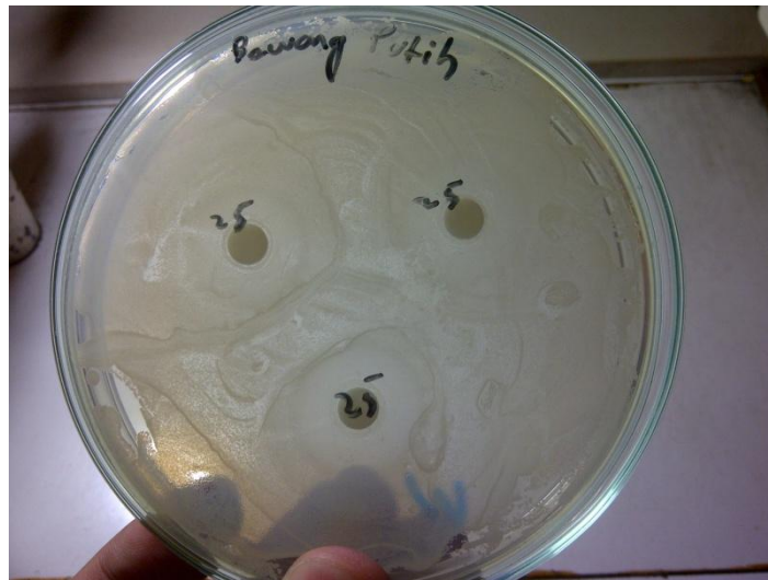
Gambar 3.3 Zona inhibisi yang terbentuk dari konsentrasi bawang putih 25%