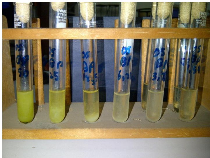
Gambar 3.2 Pengamatan hasil MIC bawang putih