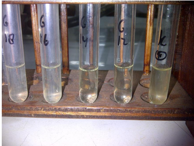
Gambar 3.1 Pengamatan hasil MIC gentamisin