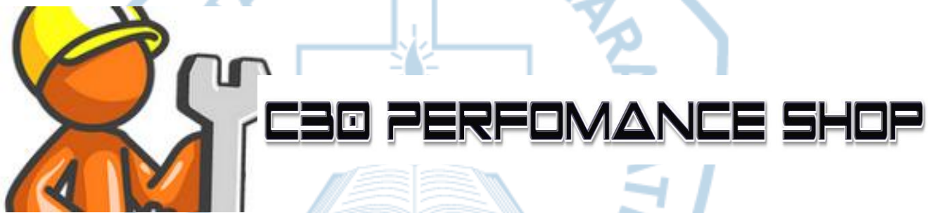
Gambar 1.1 Logo C30 Performance Shop

Bisnis yang dibuat dengan nama C30 Performance Shop , C30 Di ambil dari C merupakan huruf depan nama penulis yaitu Christian sedangkan 30 merupakan tanggal lahir penulis sendiri . Sedangkan Performance memiliki arti yaitu performa , di sini performa yang di maksud adalah performa sepeda motor itu sendiri yang di mana bisnis penulis bergerak dalam bidang otomotif , terakhir Shop yang tandanya saya menjual sparepart , part-part modifikasi dan menyediakan jasa service sepeda motor . Logo yang akan di gunakan seperti gambar di bawah ini .