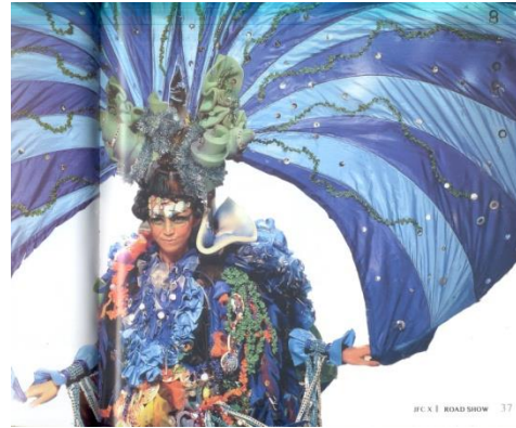
Kostum Dream Sky