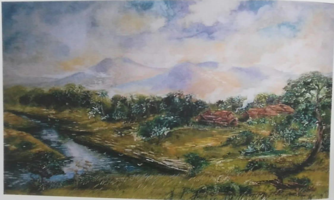
Work / Pemandangan Alam Parahyangan (2013) Artist / Ir. Lois Denissa