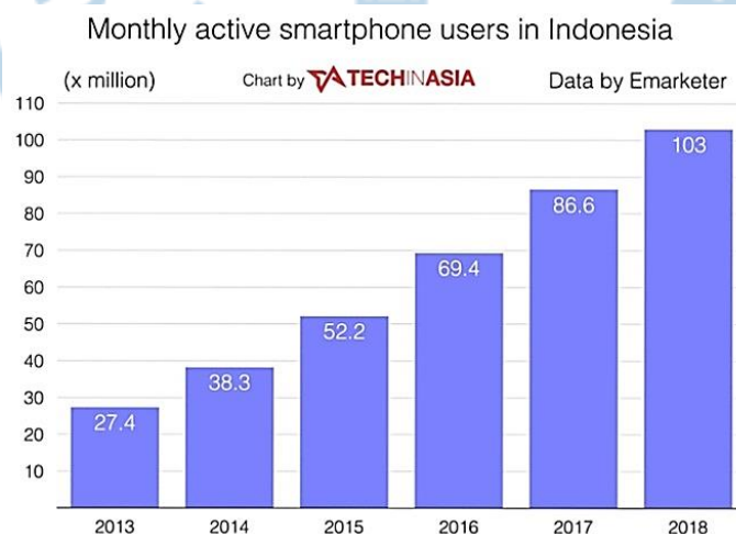
Gambar 1.3 Grafik Pengguna Aktif Smartphone di Indonesia Tahun 2013-2018

Menurut data terakhir dari www.id.techinasia.com Indonesia akan melampaui 100 juta pengguna smartphone aktif pada tahun 2018, menjadikannya negara dengan populasi pengguna smartphone terbesar keempat di dunia.