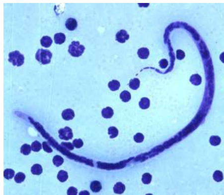
Gambar. Cacing Brugia timori