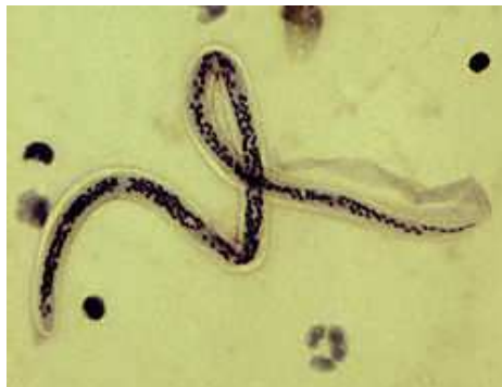
Gambar. Cacing Wuchereria bancrofti