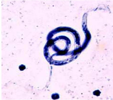
Gambar. Cacing Brugia malayi