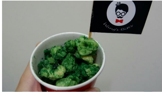
Gambar 1.3 PotaCorn Seaweed

PotaCorn Cheese adalah kentang yang dipotong dadu dan digoreng menggunakan bahan bahan terpilih dan diberi perisa keju.