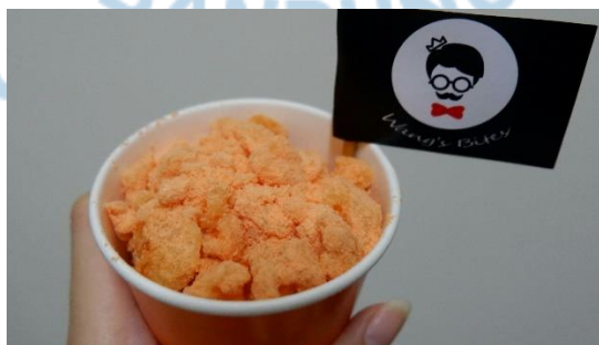
Gambar 1.2 PotaCorn Cheese

Berikut adalah beberapa contoh produk dari Wang's Bites :