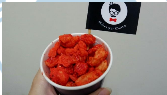
Gambar 1.4 PotaCorn Sweet Spicy

PotaCorn Seaweed adalah kentang yang dipotong dadu dan digoreng menggunakan bahan bahan terpilih dan diberi perisa rumput laut.