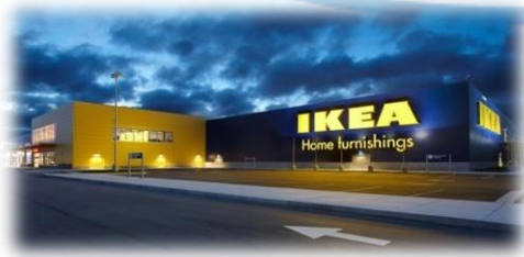
Gambar 1.1 IKEA

Konsep dalam bisnis ini adalah toko furnitur yang memberikan customer experience dengan konsep ruangan – ruangan pada konsumen, ini sedikit mencontoh seperti mini IKEA . Kenapa IKEA karena IKEA merupakan perusahaan furnitur asal Swedia terkemuka di dunia dan terbesar di Indonesia. Banyak Konsumen yang mengeluh karena barang pada Toko Murah Furniture berantakan, sulit dicari dan sulit membayangkan produk nya jika berada di ruangan, membuat konsumen tidak nyaman, sehingga hanya membuat perang harga. Sehingga disini kami memberikan solusi sebuah perbedaan ( differensiasi ) toko furnitur modern dengan ruangan-ruangan agar konsumen dapat langsung berimajinasi dan melihat visualisasi secara langsung bagaimana jika produk berada di ruangan.