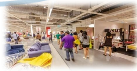
Gambar 1.2 Ruangan IKEA