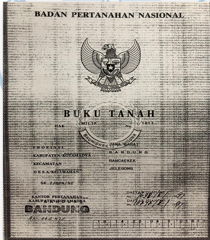
Gambar 1.4 Sertifikat Tanah Toko Murah Furnitur

Bentuk perizinan usaha sudah jelas berdasarkan nomer SIUP: 1345/13-7/pk/IX/1994.