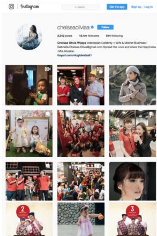
Gambar 2. Lini Masa Akun Instagram Chelsea Olivia (diakses 20 Maret 2018)