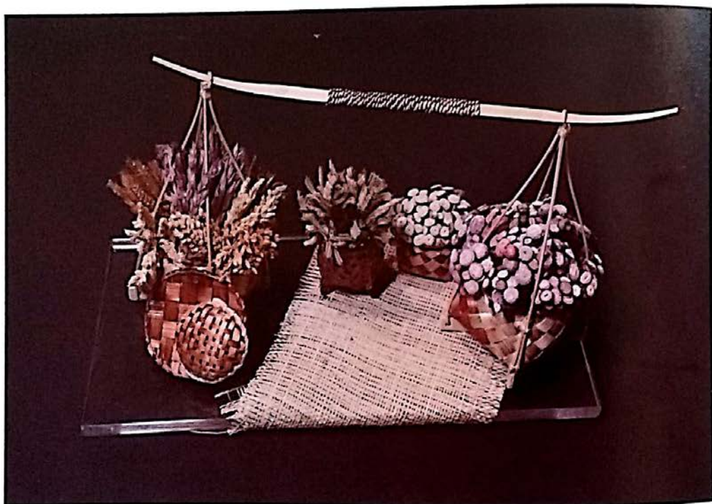
我的篮子 Keranjang Saya