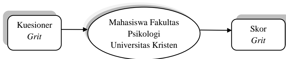
Bagan 2. Rancangan Penelitian

Secara sistematis, desain rancangan penelitian ini dapat digambarkan sebagai berikut: