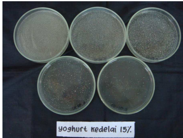
Gambar L1. 4 Hasil Penghitungan Koloni Candida albicans dalam Susu Kedelai