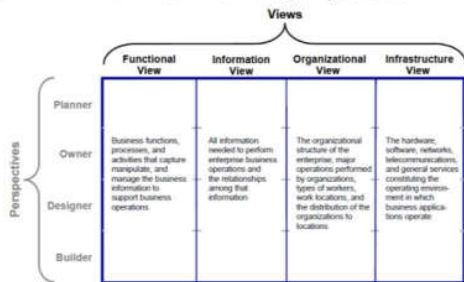
Gambar 1 Views pada TEAF [1]

Views (gambar 1) adalah “Sebuah representasi dari suatu sistem secara keseluruhan dari perspective yang terkait.” Views terdiri dari sekelompok Work Product yang perkembangannya memerlukan keahlian analitis dan teknis tertentu karena berfokus pada, "What", "How", "Who", "Where", "When", atau "Why" dari perusahaan. Views direpresentasikan oleh kolom-kolom dalam TEAF Matrix dan melintasi perspectives .