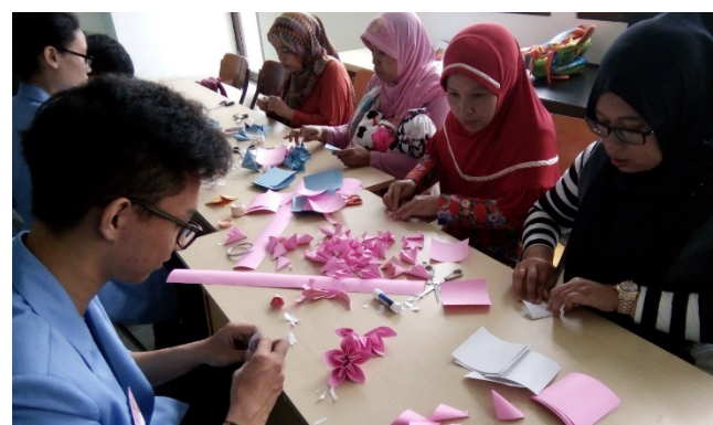
Gambar 7. Membuat beberapa bunga untuk dirangkai