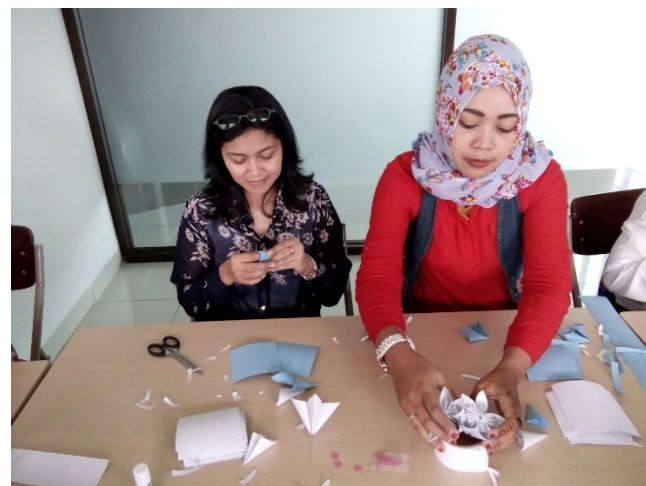
Gambar 6. Merakit modul satuan menjadi bentuk bunga

Pada perkembangannya nanti bunga ini dapat dibuat menggunakan berbagai macam kertas termasuk kertas limbah. Namun karena ini merupakan pelatihan pada tahap yang sangat awal dan penggunaan kertas limbah juga cukup membutuhkan kreativitas agar mendapatkan hasil tampilan yang maksimal, maka diputuskan pada tahap awal ini menggunakan kertas atau karton dalam kondisi baru. Dengan demikian hasil tampilan dapat dipastikan dapat dinikmati dengan baik.