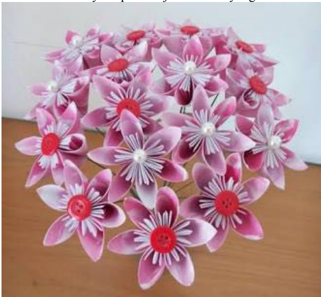
Gambar 9, Tampilan bunga setelah diberi kawat dan dirangkai

Bunga yang terbentuk dari 5 modul dasar disatukan menggunakan lem dan diberi aksesoris kancing untuk menggambarkan putik bunga. Kancing juga merupakan bahan yang cukup mudah didapat dan tersedia di dalam berbagai warna, bentuk dan ukuran, sehingga dengan kreativitas nantinya dapat menjadi elemen yang menarik.