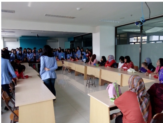
Gambar 3. Perkenalan para ibu dan guru PAUD dengan dosen dan mahasiswa