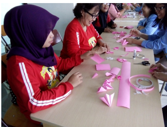
Gambar 4 . Belajar memotong pola dasar karton

Secara umum ibu-ibu peserta pelatihan ini mengikuti dengan bersungguh-sungguh setiap tahap yang dijelaskan. Mulai dari memotong bentuk kertas dasar dan melipat menjadi modul-modul bunga dasar, dapat dikerjakan dengan seksama. Hal ini menjadi penting di dalam pembuatan origami modular, karena bila pembuatan modul dasar tidak sama atau kurang rapi maka hasil rakitan akan menjadi kurang maksimal.