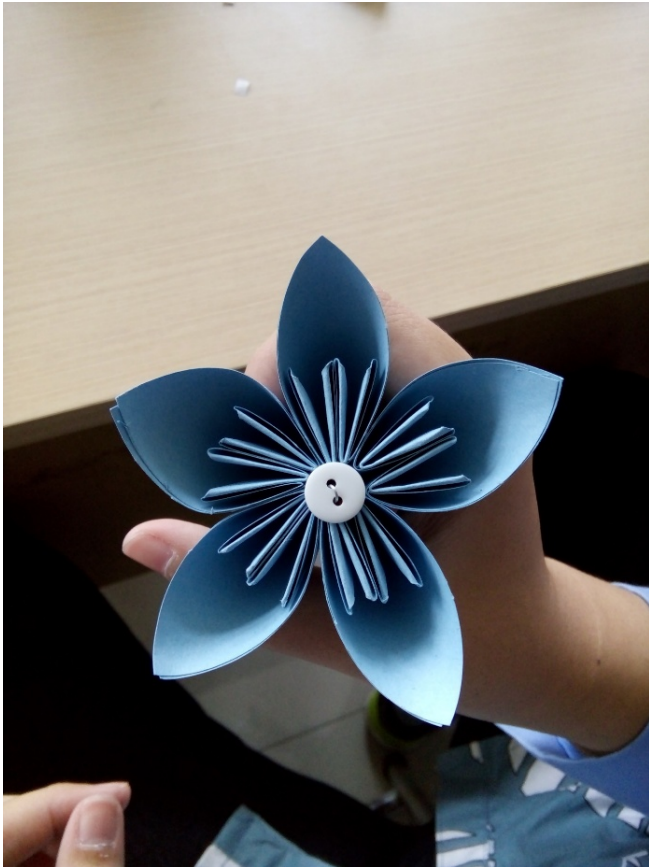
Gambar 8. Tampilan satu bunga yang terdiri dari 5 modul dasar

Bunga yang terbentuk dari 5 modul dasar disatukan menggunakan lem dan diberi aksesoris kancing untuk menggambarkan putik bunga. Kancing juga merupakan bahan yang cukup mudah didapat dan tersedia di dalam berbagai warna, bentuk dan ukuran, sehingga dengan kreativitas nantinya dapat menjadi elemen yang menarik.