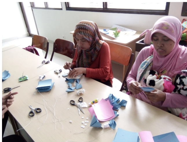
Gambar 5. Belajar melipat modul satuan