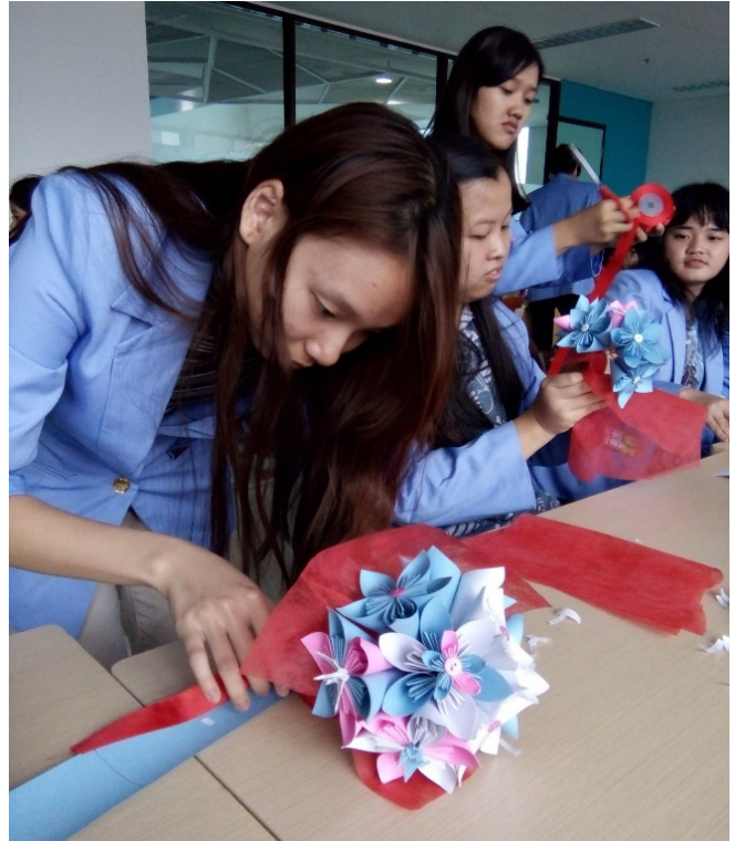
Gambar 10. Buket bunga diberi kertas pembungkus dan pita

Dengan demikian para ibu telah dapat membuat sebuah produk final berupa buket bunga yang dapat berfungsi sebagai hand bouquet atau dirangkai di vas bunga dan diletakkan di berbagai tempat di sebuah ruangan.