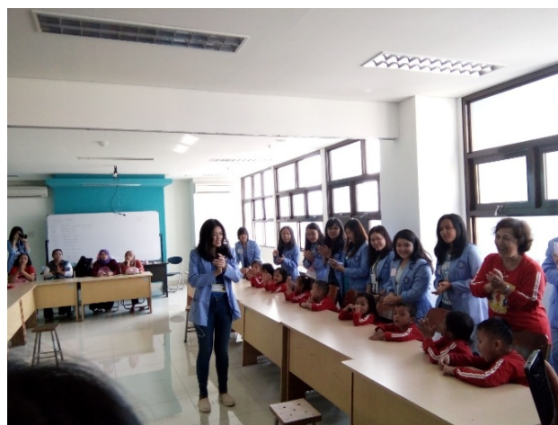
Gambar 2. Pembukaan acara dengan bernyanyi bersama