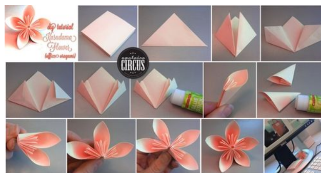
Gambar 1. Gambar rencana pembuatan bunga

Ketrampilan yang akan diajarkan adalah pembuatan bunga kertas dengan aksesoris kancing yang nantinya akan dirangkai menjadi sebuah buket. Bahan terdiri dari karton manila, gunting, lem, kancing, kawat bunga, pita dan kertas untuk membungkus buket. Program ini dapat diselesaikan dalam waktu sekitar 2 jam dengan dukungan peralatan sederhana yang dapat diperoleh dan dibawa dengan mudah.