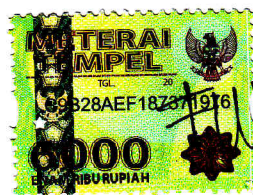
Fuji Fauzziah Dwiyantri