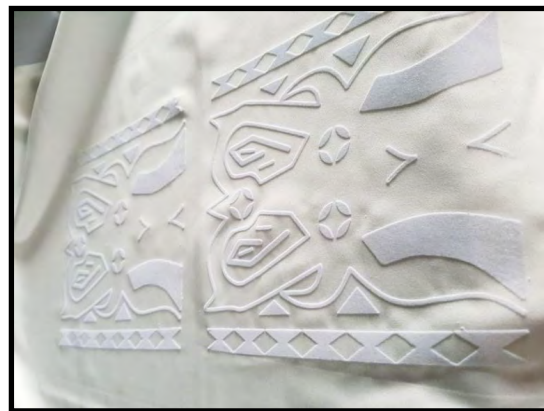
Gambar 9. Hasil sablon flock motif Pa'tedong

Teknik penjahitan beads (payet) dapat memberikan manfaat berupa technocraft dan craftsmanship . Pengaplikasian teknik ini menambah kesan unik dan mewah pada busana melalui beads berbentuk bulir berwarna merah, kuning, hitam, dan putih.