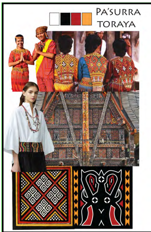
Gambar 1. Image Board

Berdasarkan ringkasan landasan teori tentang busana dan kebudayaan yang ada pada suku Toraja di atas, maka dapat ditampilkan melalui image board sebagai berikut: