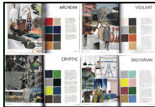
Gambar 2. Buku Grey Zone

Meski didominasi oleh kegelapan, dengan kebenaran atau kesalahan menjadi suatu yang relatif abu-abu, namun bukan berarti tidak ada warna atau harapan yang mungkin muncul akibat adaptasi kemanusiaan terhadap kecerahan harapan dan stabilitas sistem kehidupan. Dalam buku Grey Zone sendiri membagi empat tema besar di dalamnya, yaitu: Archeon, Vigilant, Cryptic, dan Digitarian.