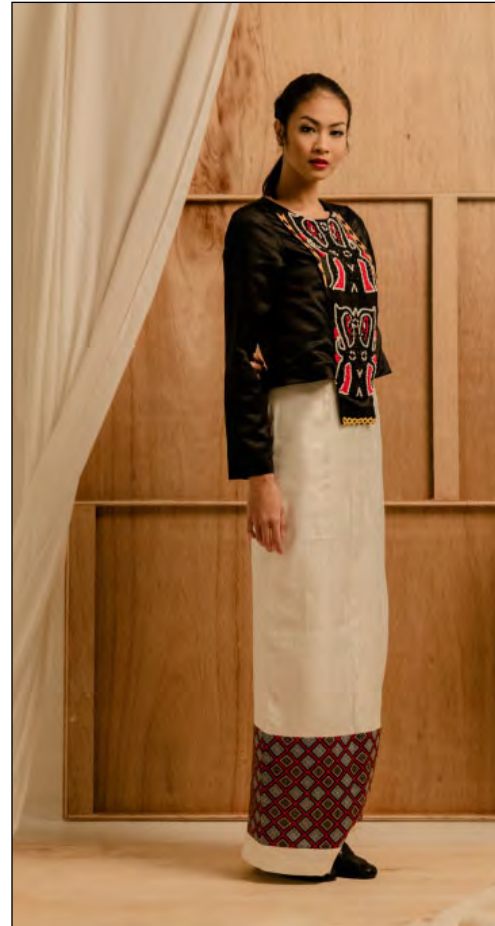
Gambar 14. Photoshoot Desain IV

ukiran Pa'sekong Kandaure ditempatkan pada bagian tengah bawah rok. Pewarnaan menggunakan teknik digital printing . Pada bagian tengah rok depan ditempatkan motif Pa'tedong yang disablon flock .