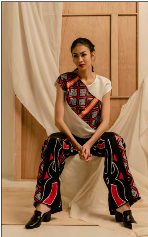
Gambar 12. Photoshoot Desain II

Celana panjang dibuat dari bahan taffeta bridal dengan pewarnaan motif Pa'sekong Kandaure dan Pa' tedong menggunakan teknik digital printing . Ilustrasi motif Pa'sekong Kandaure ditempatkan pada bagian sisi depan celana panjang. Ilustrasi dua motif Pa'tedong ditempatkan pada bagian tengah depan, dengan penerapan teknik beads pada motif. Pada bagian sisi belakang celana panjang ditambahkan aksesoris dari motif Pa'tedong.