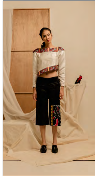
Gambar 11. Photoshoot Desain I

ditempatkan di bawah celana dengan tambahan beads pada motif.