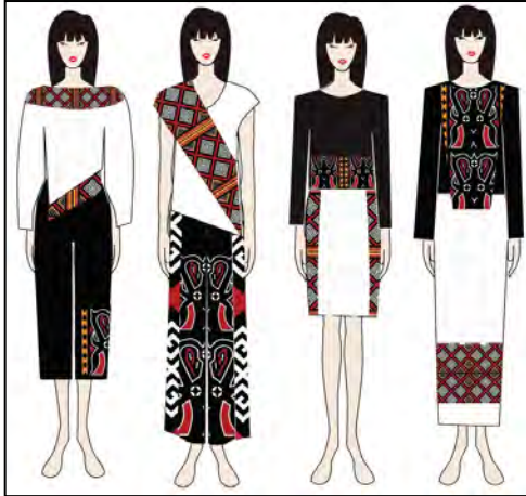
Gambar 6. Desain koleksi busana tampak depan