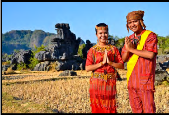
Gambar 4. Pakaian adat Toraja