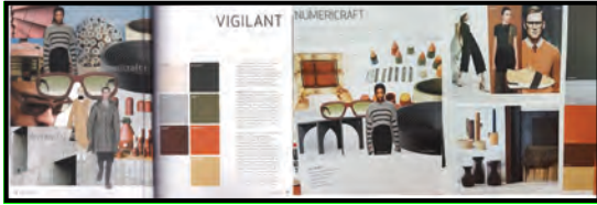
Gambar 3. Tema dan subtema terpilih

Istilah busana berasal dari Bahasa Sansekerta yaitubhusana, yang kemudian populer dalam Bahasa Indonesia menjadi busanaberarti pakaian( http://www.kelasbusana.com/2016/01/pengertian-busana-jenis-dan-fungsinya.html ).