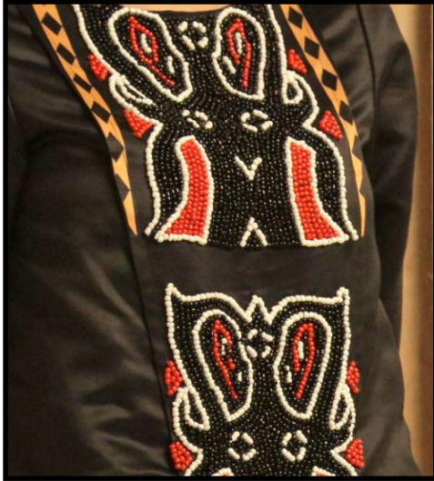
Gambar 10. Hasil teknik beads motif Pa'tedong