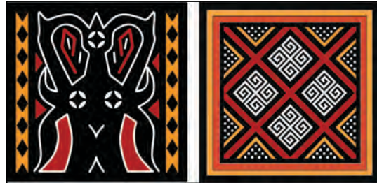
Gambar 8. Desain motif Pa'sekong Kandaure dan Pa'tedong

dengan hasil scan menggunakan Adobe Illustrator, kemudian motif ukiran Pa'sekong Kandaure dan Pa'tedong diletakkan pada posisi yang telah ditentukan.