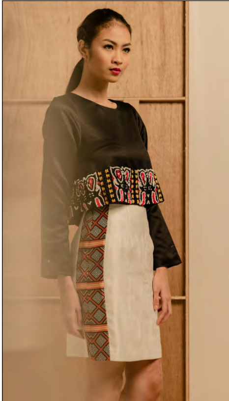
Gambar 13. Photoshoot Desain III Sumber: dokumentasi penulis, 2016