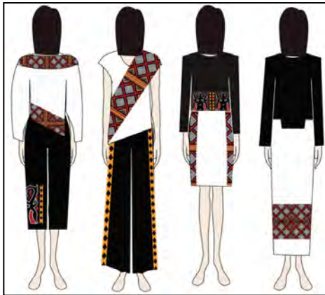
Gambar 7. Desain koleksi busana tampak belakang

Perancangan detail pada busana terdiri dari motif ukiran Suku Toraja dan aksesoris pada koleksi Pa'surra Toraya berupa sepatu sandal. Proses perancangan desain yang dibuat melalui proses printing , sablon flock , dan beads diterapkan pada motif yang ada pada busana. Proses pembuatan motif Pa'sekong Kandaure dan Pa'tedong menggunakan program Adobe Illustrator. Penerapan printing gambar pada busana melalui proses pola dan visualnya dibuat