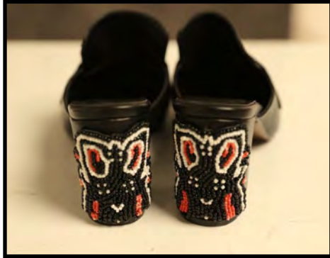
Gambar 15. Desain I aksesoris (sepatu sandal) Sumber: dokumentasi penulis, 2016

teknik beads pada bagian muka ditambah lapisan lidah seperti loafers .