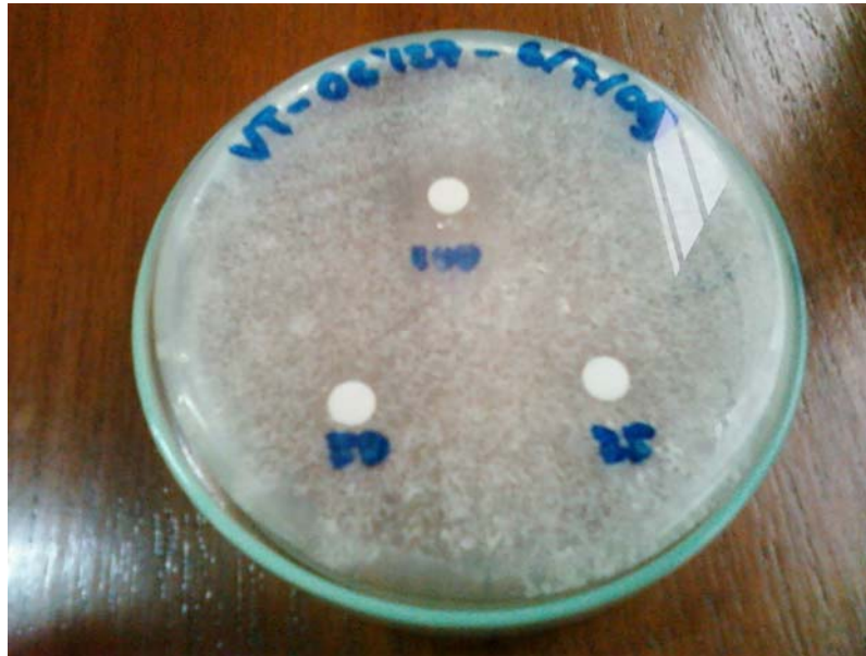
Foto 1. Zona inhibisi pertumbuhan Candida albicans setelah diberi cakram air perasan rimpang lengkuas merah dengan konsentrasi 100%, 50%, dan 25%