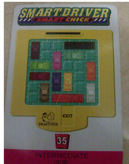
Pola traffic jam puzzle sesudah sarapan