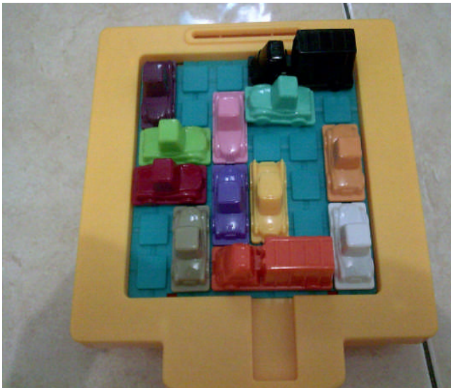
Pola traffic jam puzzle sebelum sarapan