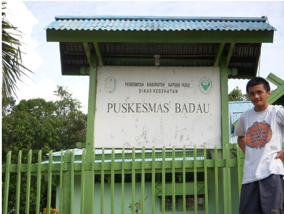
Gambar L 2.1 Puskesmas Badau