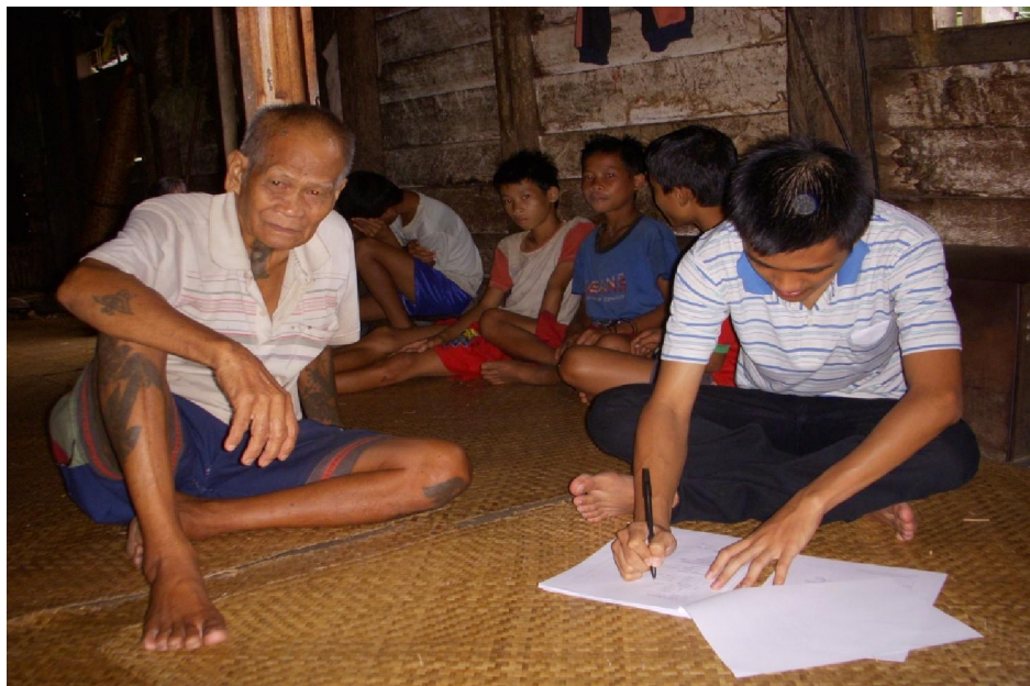
Gambar L 2.3 Proses wawancara dengan bantuan kuesioner