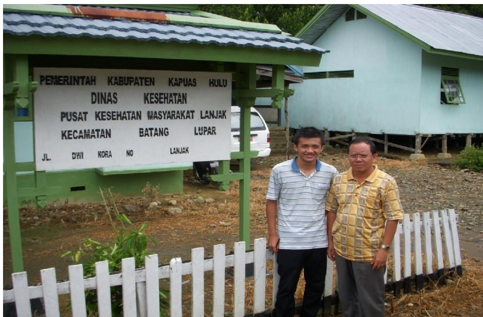
Gambar L 2.2 Puskesmas Lanjak