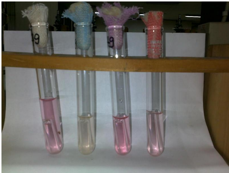
Gambar L5, Hasil tes fermentasi Candida albicans

Keterangan : tabung 1 (glukosa) : positif dengan gas