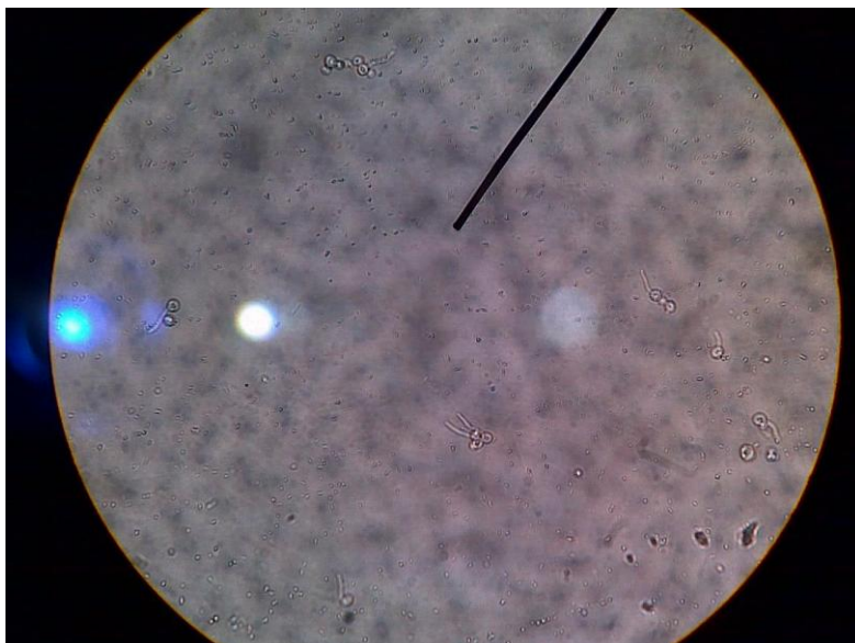
Gambar L6, Tes germ tube Candida albicans