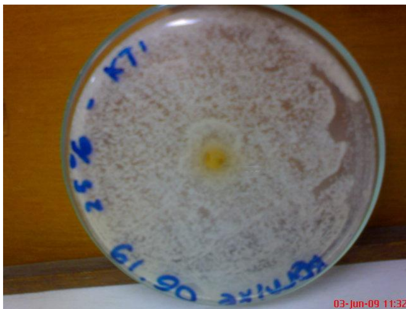
Gambar L2, Tak ada zona hambatan pertumbuhan Candida albicans oleh ekstrak air temu putih pada konsentrasi 25%