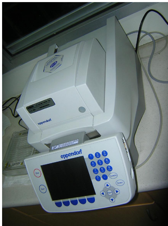
Mesin Thermal Cycler