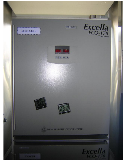
Inkubator kultur sel