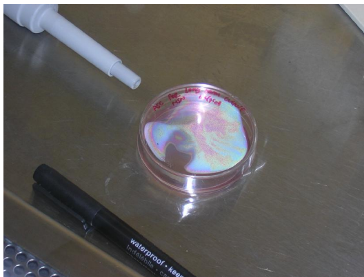
Plate kultur MSCs