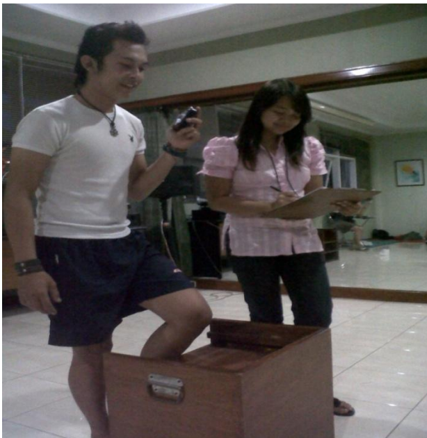
Tes Bangku Astrand-Rhyming