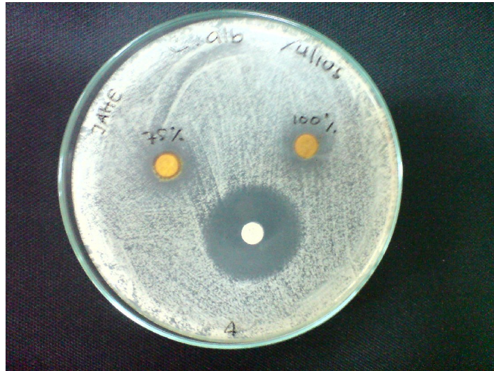
Foto 1. Zona inhibisi pertumbuhan Candida albicans setelah diberi perlakuan EERJM dengan konsentrasi 75% dan 100% serta zona inhibisi pertumbuhan Candida albicans terhadap nistatin sebagai kontrol positif.