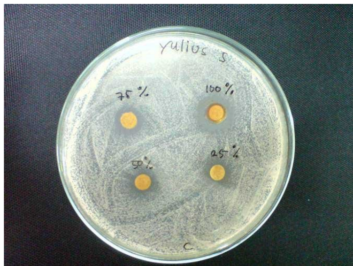
Foto 2. Zona inhibisi pertumbuhan Candida albicans setelah diberi perlakuan EERJM dengan konsentrasi 25%, 50%, 75% dan 100%