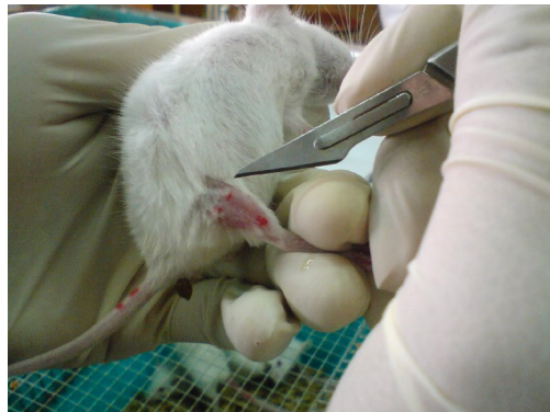
Pembuatan Luka pada Mencit