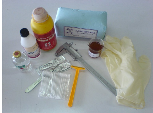
Alat dan Bahan Percobaan