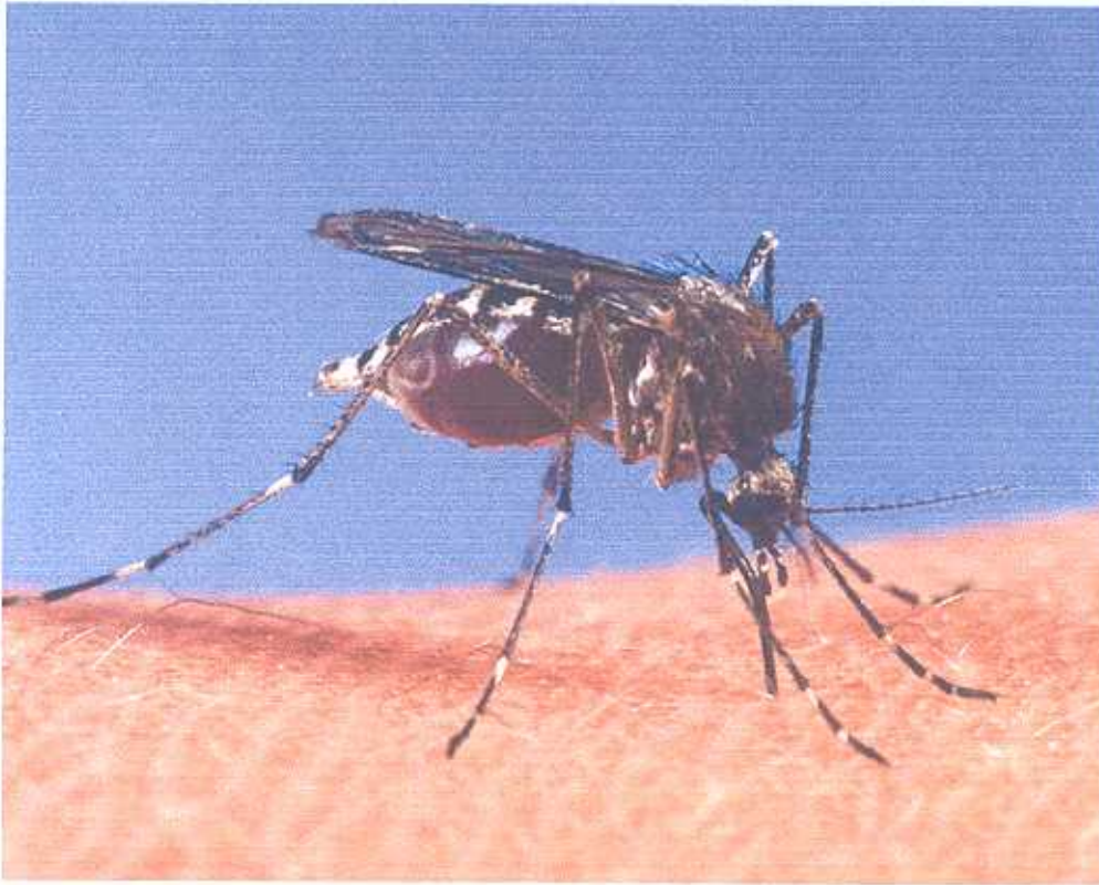
Gambar 1. Nyamuk Aedes aegypti