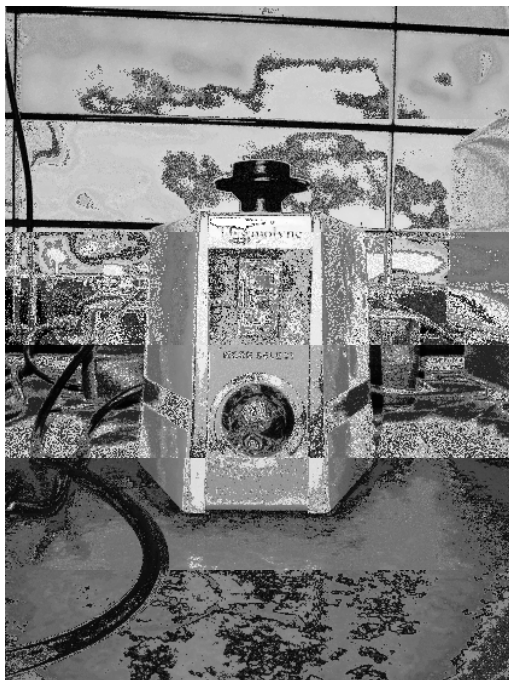
Gambar 1.A.4 Vortex (orbital shaker)