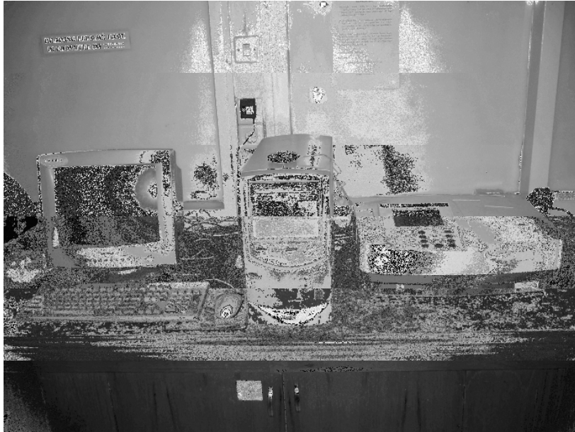
Gambar 1.A.5. Spektrofotometer