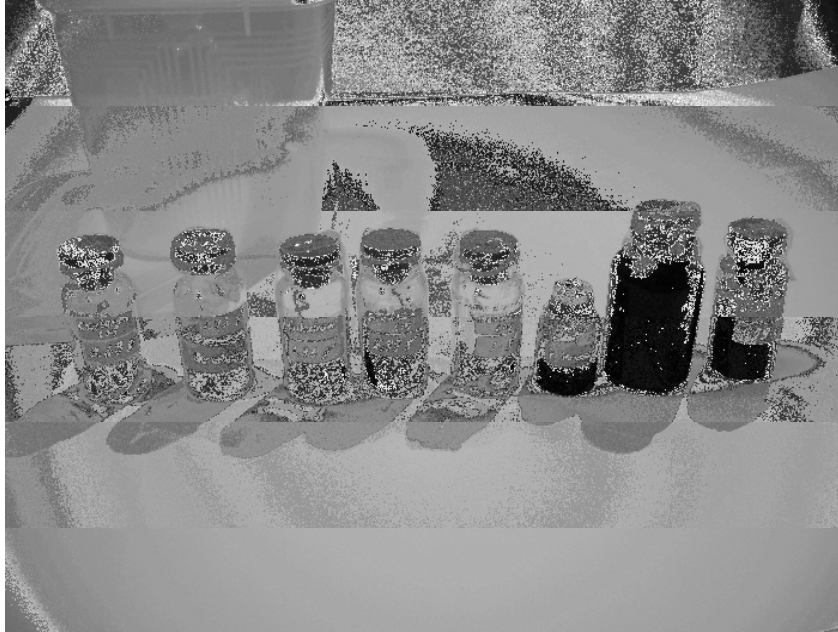
Gambar 1.B.1 Ekstrak Rumput Laut