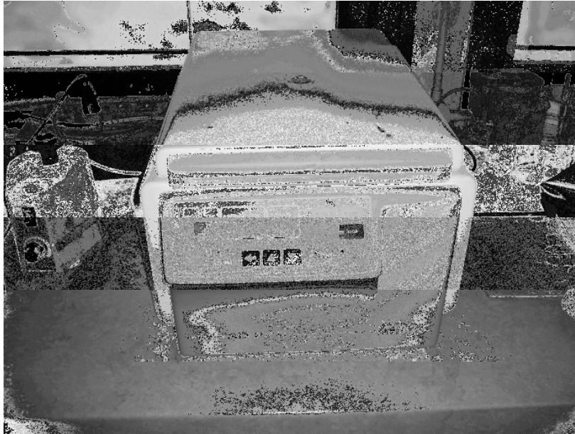
Gambar 1.A.3 Mikrosentrifuge