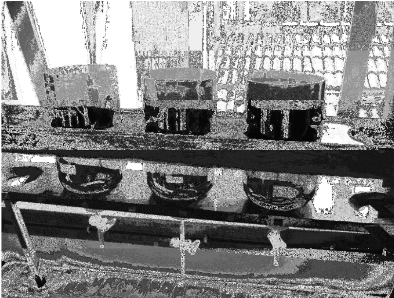
Gambar 1.A.1 Maserator