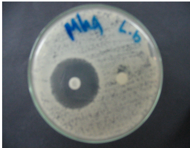
Foto 2. Zona inhibisi pertumbuhan Candida albicans setelah diberi perlakuan dengan parutan lidah buaya dan zona inhibisi pertumbuhan Candida albicans terhadap nistatin sebagai kontrol positif