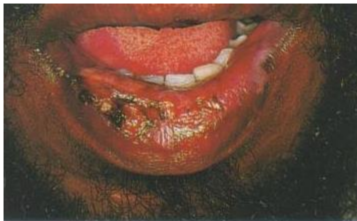
Gambar 3. Eritema multiform pada bibir yang bengkak dan terdapat krusta 8

Eritema multiforme di rongga mulut yang ringan dapat di rawat dengan perawatan suportif seperti obat kumur anestesi topikal dan makan-makanan yang lunak. Pada kasus dengan lesi yang luas dan lebih berat dapat diatasi dengan kortikosteroid sistemik jangka pendek kecuali pada pasien dengan kontraindikasi penggunaan steroid. 1,10