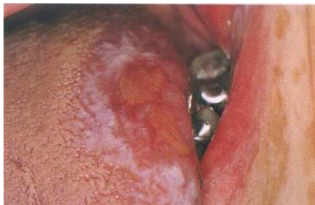
Gambar 10. Lesi lichenoid pada lidah akibat restorasi logam 11