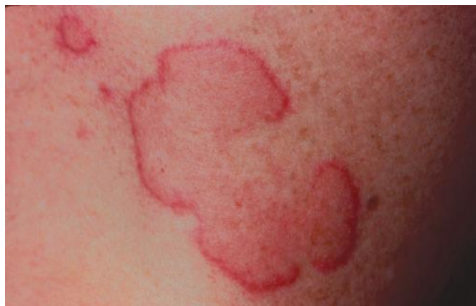
Gambar 1. Urtikaria yang terjadi pada kulit karena obat 7

Urtikaria dan angioedema hanya bersifat sementara. Kondisi ini akan menimbulkan masalah jika oedema terjadi pada daerah posterior lidah atau laring karena gangguan pada saluran pernapasan. Penanganan kondisi tersebut adalah dengan injeksi epinefrin secara intramuskuler sebanyak 0.5 mL (1:1000) yang diulang 10 menit sekali dan pemberian oksigen jika masih terdapat pembengkakan. 7,8