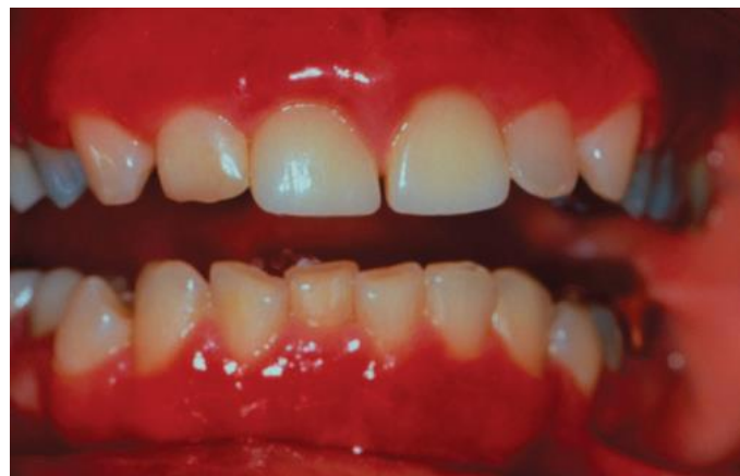
Gambar 7. Gingivitis plasma sel 7