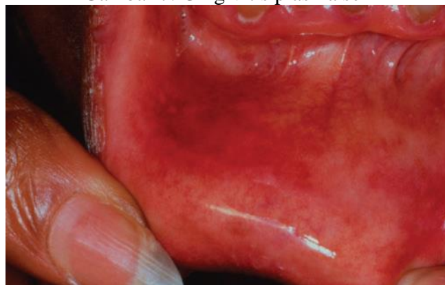
Gambar 8. Kontak alergi terhadap peppermint pada mukosa labial 7