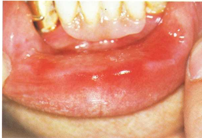
Gambar 6. Stomatitis akibat kontak alergi dengan resin akrilik 8