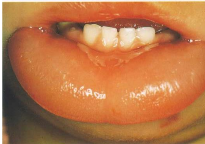
Gambar 2. Angioedema pada bibir 8