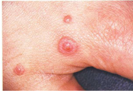
Gambar 5. Lesi target atau iris lesion pada kulit yang menjadi ciri khas eritema multiform 11