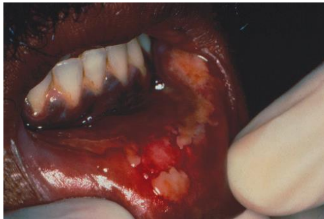
Gambar 4. Eritema multiform pada mukosa bibir, terdapat lepuh yang pecah menjadi ulser 7